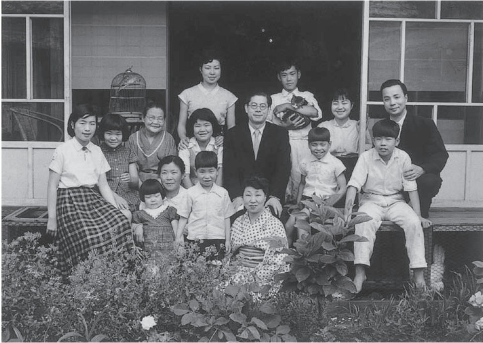
家族と子どもたち

ローチが必要であると強調したところに特徴がある。これは「松島先生から身近かで話を伺う」経験から得たヒントによるという。