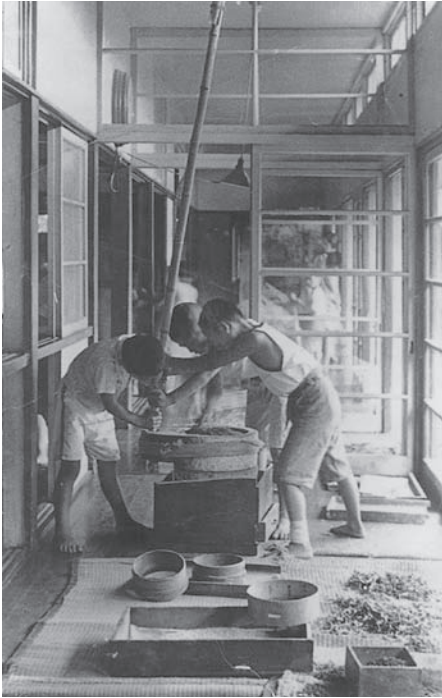
食糧危機には乾した野草を石臼で粉にして食べた