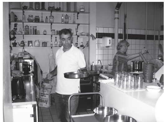
店内の様子。無料で飲めるミントティーがいつも用意されている。