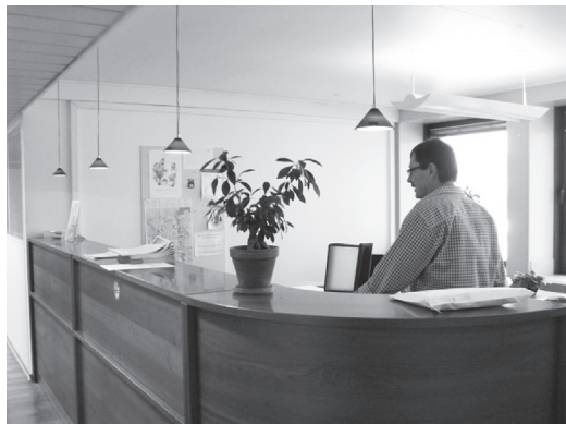
独立行政法人ボランティアソーシャルワークセンター

関わる内容に特化しており、文化や余暇、あるいはスポーツに関する活動を支援するというよりも、広義の社会福祉に関するに関するコンサルティング、図書館機能の提供、有料・無料コースの提供、無料電話相談を実施している。