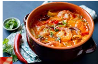
↑ムケッカ（海老や野菜 など沢山の食材が入った スープ）